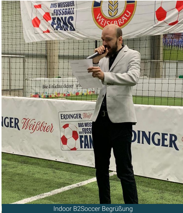
Indoor B2Soccer Begrüßung