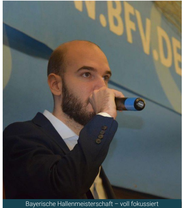
Bayerische Hallenmeisterschaft – voll fokussiert